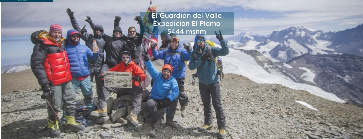
El Guardián del Valle Expedición El Plomo 5444 msnm